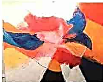
L. Mischiatti, "Svirgola"

Per gli interessati ai quadri o semplicemente per chi vuole saperne di più, è possibile contattare la sede di Fidenza (T. 0524 521047, e-mail: bambini@autismo-pr@adshet.it)